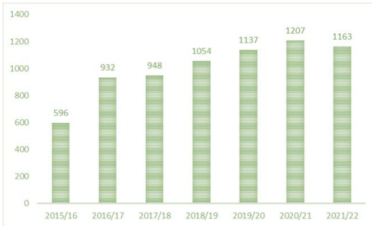
Graf 1: Počet študentov so špecifickými potrebami na vysokých školách na Slovensku